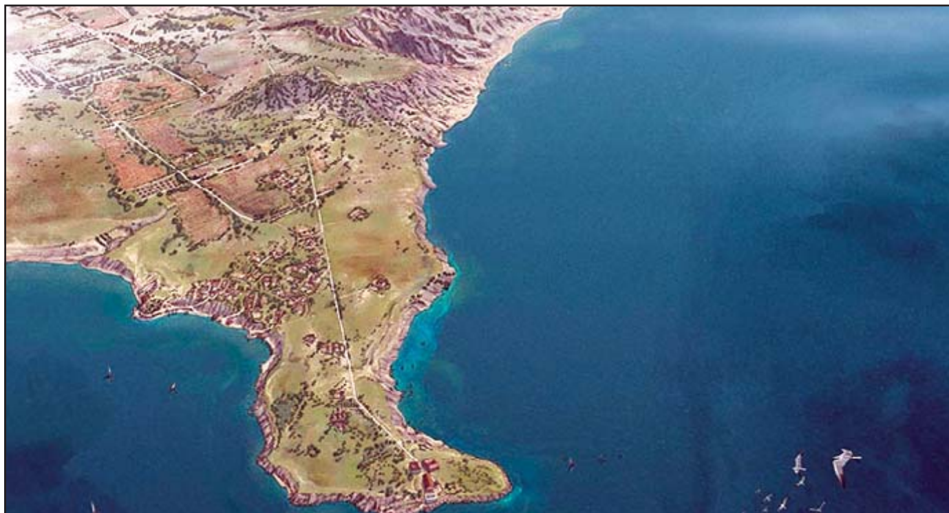
Dal Lacinio a Kroton (InkLink 2026 - PAK)